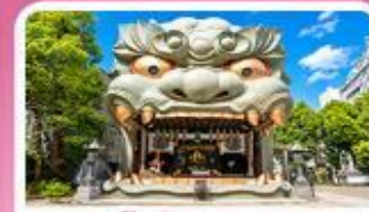
ศาลเจ้านิมบะ ยาซากะ