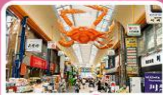
ตลาดคูกุโรมง

เดินทาง 03 - 07 ก.ค. 69 | 19 - 23 ส.ค. 69 | 25 - 29 ก.ย. 69