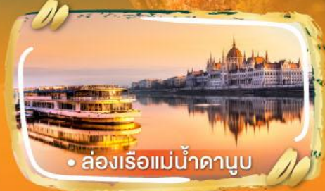
• ส่องเรือแม่น้ำดานูบ

ไฮไลท์ในโปรแกรม • เยอรมัน เมืองเก่าสุดคลาสสิก ฟัลยูโรปเต็มสิบ • เก็บโมเมนต์สวย ๆ ในบูดาเปสต์ เมืองแห่งแสงไฟ • บราติสลาวา เมืองเล็กแต่น่ารักเกินต้าน • เบอร์โน ซิลส์ง่าย สไตล์ยุโรปแท้ ๆ • คาร์โรวัวร์ เมืองน้ำแร่ • ซาลสบูร์ก เมืองดนตรี วิวดิทุกมุม • เวียนนา เมืองหรรุคลาสสิก สมมงยุโรปสุด ๆ