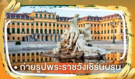
• ถ่ายรูปพระราชวังเซรินบรุน