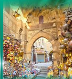
ตลาดย่านเวลคาลิส์

** ชำระค่าทัวร์ในนาม บริษัท นิดน้อย ทราเวล จำกัดเท่านั้น **