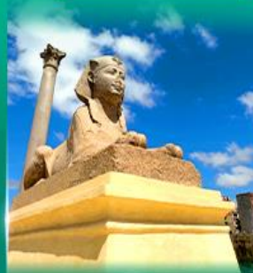
เสาโรห์มันบอมเบย์