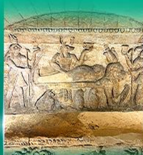
สุสานใต้ดินवलีกษานเดรีย