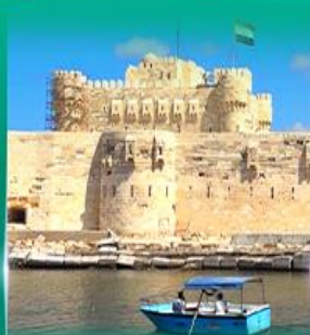
ป้อมปราการ Quite Bay