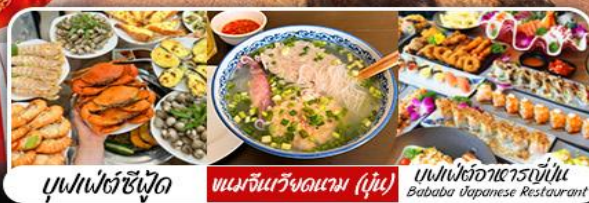
บุฟเฟ่ต์ซีฟู้ด | เมนูจีนเวียดนาม (หุ่น) | บุฟเฟ่ต์อาหารญี่ปุ่น Bababa Japanese Restaurant