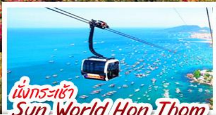
นั่งกระเช้า Sun World Hon Thom