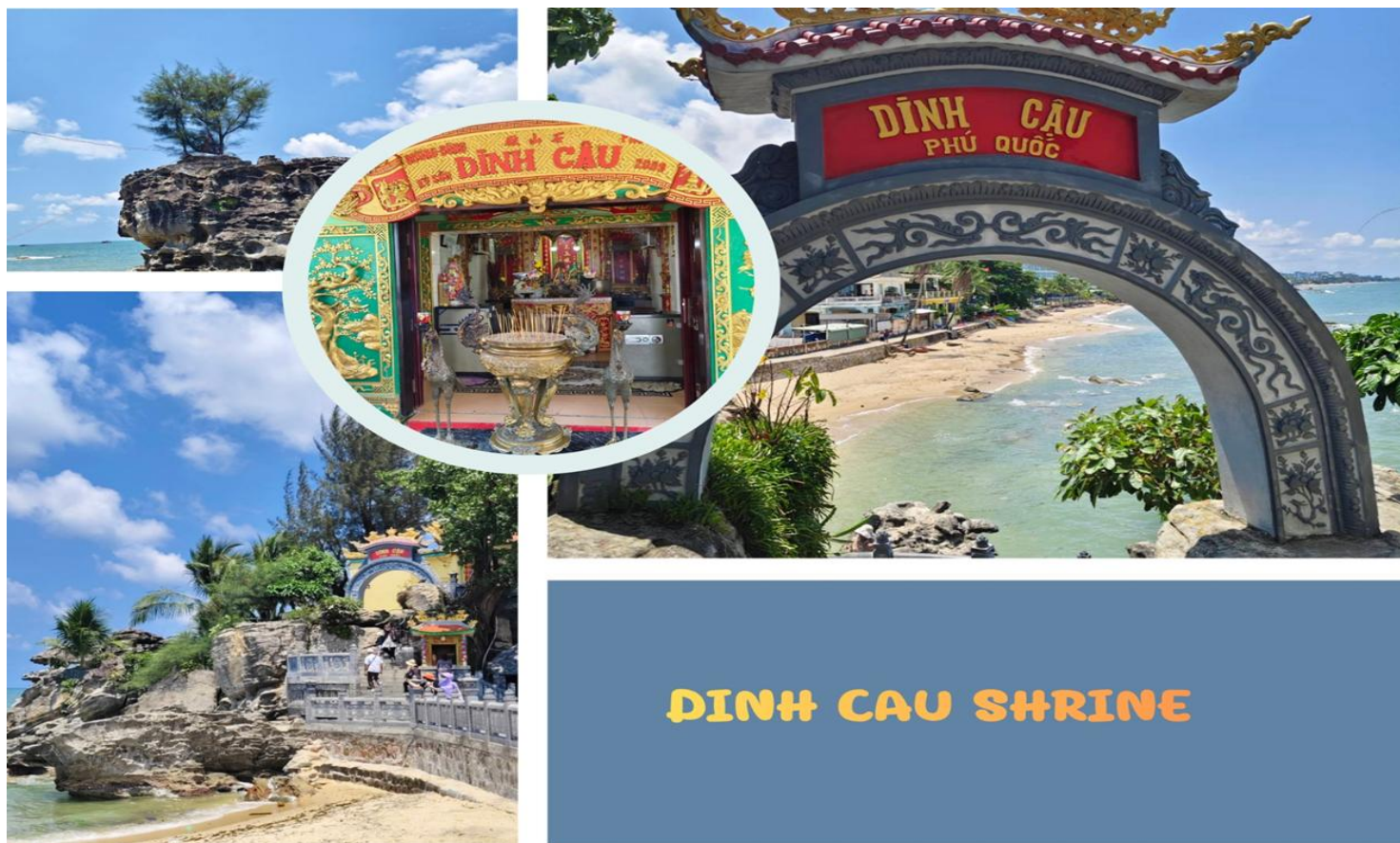
DINH CAU SHRINE

เช้า รับประทานอาหารเช้า ณ ห้องอาหารของโรงแรม ( มื้อที่ 4 )