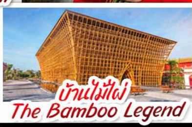
บ้านไม้ไผ่ The Bamboo Legend