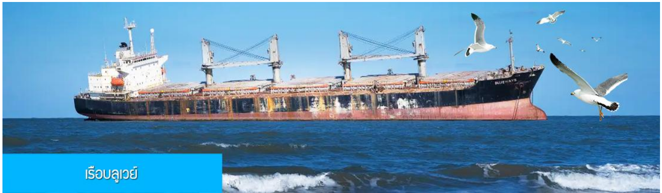
เรือลูวีย์

** ชำระค่าทัวร์ในนาม บริษัท นิดน้อย ทราเวล จำกัดเท่านั้น **