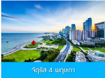
จิตรลิส 4 พุชกา

** ชำระค่าทัวร์ในนาม บริษัท นิดน้อย ทราเวล จำกัดเท่านั้น **