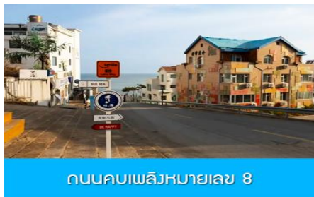
ถนนคอปเพลิงหมายเลข 8