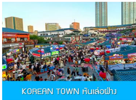
KOREAN TOWN หินล้อมฟ้า