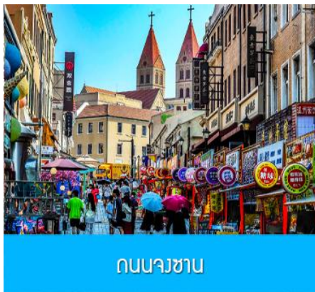
ถนนจงซาน