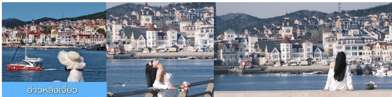
อ่าวหลิงเจี้ยว

** ชำระค่าทัวร์ในนาม บริษัท นิดน้อย ทราเวล จำกัดเท่านั้น **