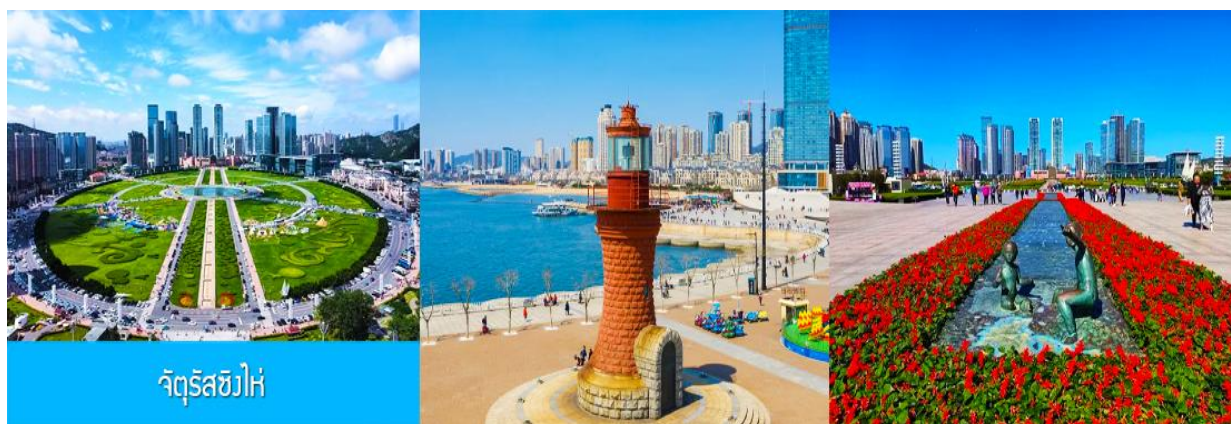
จัตุรัสซีไห่

นำท่านเที่ยวชม ถนนญี่ปุ่น 日本风情街 เป็นอีกหนึ่งแหล่งช้อปปิ้งที่นักท่องเที่ยวแนวช้อปปิ้งไม่ควรพลาด ได้รับความนิยมว่าเป็น เกียวโตน้อยแห่งราชวงศ์ถัง 盛唐小京都 ออบแบบโดยสถาปนิกชาวญี่ปุ่น และใช้วัสดุที่นำเข้ามาจากญี่ปุ่นในการก่อสร้าง ที่นี้ถูกเนรมิตให้กลายเป็น เมืองเกียวโตขนาดย่อม และเป็นจุดเช็คอิน ถ่ายภาพสำหรับนักท่องเที่ยวสมัยใหม่..