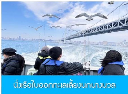
นั่งเรือใบออกทะเลลิ้นนกนางนวล