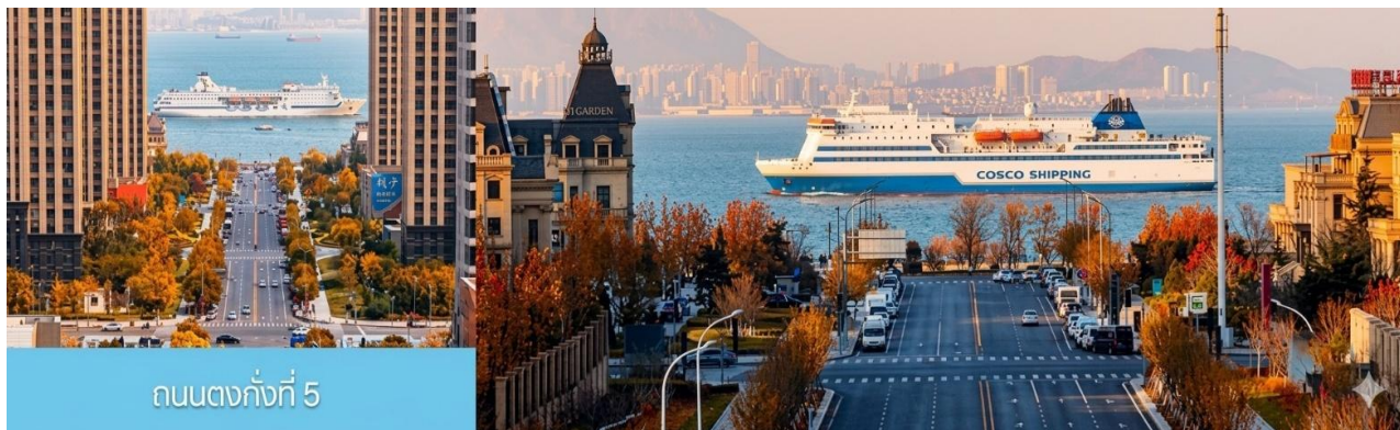
ถนนตงกั้งที่ 5

เที่ยง รับประทานอาหารกลางวัน ณ ภัตตาคาร (5)