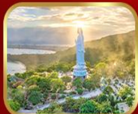
ชอพรกวนอิม วัดหลินอิ่ง