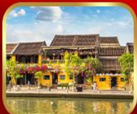
เที่ยวเมืองเก่าฮอยอัน