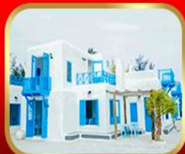
คาเฟ่ Son Tra Marina

** ชำระค่าทัวร์ในนาม บริษัท นิดน้อย ทราเวล จำกัดเท่านั้น **