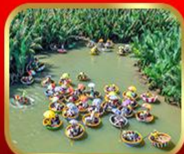
ล่องเรือกระดิ่งกัมทาน