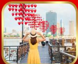
เชิควินสะพานแห่งความรัก