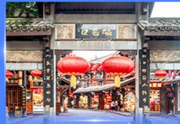
หมู่บ้านโบราณฉิวซีโหว่

** ชำระค่าทัวร์ในนาม บริษัท นิดน้อย ทราเวล จำกัดเท่านั้น **