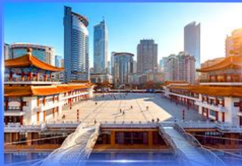
เซ็กจิน ตึกโค่วซิงโหล