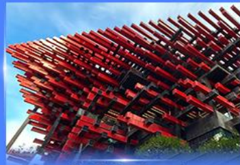
แลนด์มาร์คตึ๊ง ตึกตะเกียบ