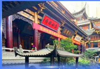
วอพรวัดหลิวฮั่น ฉงชิ่ง