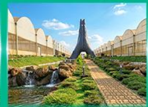
Agro Vege Farm

** ชำระค่าทัวร์ในนาม บริษัท นิดน้อย ทราเวล จำกัดเท่านั้น **