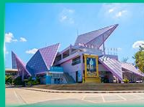
ด่านพรมแดนช่องเม็ก