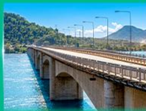
สะพานมิตรภาพลาว - ชุมปูน