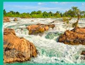
น้ำตกหลี่ผี