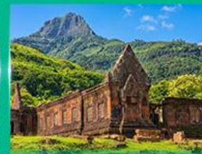
ปราสาทหินวัดพู