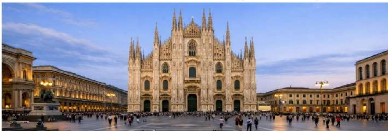
GG02(B) อิตาลี สวิตเซอร์แลนด์ ฝรั่งเศส 10 วัน 7 คืน

นำท่านเดินทางไปยัง เมืองมิลาน เป็นเมืองหลวงของแคว้นลอมบาร์เดีย และเป็นเมืองสำคัญในภาคเหนือของอิตาลี ตั้งอยู่บริเวณที่ราบลอมบาร์ดีมีชื่อเสียงในด้านแฟชั่นและศิลปะ ซึ่งมิลานถูกจัดให้เป็นเมืองแฟชั่นในลักษณะเดียวกับนิวยอร์ก ปารีส ลอนดอน และ โรม นอกจากนี้ มิลานยังเป็นที่รู้จักจากประเพณีคริสต์มาสที่เรียกว่า ปานเนตโตเน (Panettone) อุตสาหกรรม ผ้าไหม และแหล่งผลิตรถยนต์ อัลฟา โรมิโอ รวมไปถึง สโมสรฟุตบอลอินเตอร์มิลาน และสโมสรฟุตบอลเอซีมิลาน ถ่ายรูปกับ มหาวิหารแห่งมิลาน(Duomo di Milano) เป็นสัญลักษณ์ที่โดดเด่นที่สุดของเมืองมิลาน และเป็นวิหารหินอ่อนสถาปัตยกรรมโกธิคที่ใหญ่ที่สุดในโลก ซึ่งใช้เวลาสร้างนานถึง 500 ปี ลักษณะเด่นของวิหารที่นอกเหนือจากความวิจิตรงดงามแล้ว ยังประดับไปด้วยรูปปั้นนับกว่า 3,000 รูปที่สวยงามไม่แพ้กัน