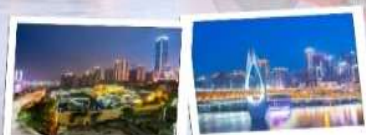
Option 3: Nanbin Road (南滨路) + คาเฟ่ River Viewing Cafe

📍 ที่ตั้ง : เขต Muzhong 🕒 เวลาเปิด-ปิด : 10:00 - 23:00 น. 💰 ค่าเช่า : ฟรี 🚶 การเดินทาง : รถไฟใต้ดินสาย 2 หรือ 6 สถานี Chaotianmen (朝天门站) 🚶 ไรด์ไลน์ : อยู่ตึกที่ Raffles City เชิญไปนั่งชิลที่ร้านกาแฟ เดินเล่นไปชมตึกแก้วบริเวณ Chaotianmen Square 📍 คาเฟ่แนะนำ : Manner Coffee (曼纳咖啡) 📍 ที่ตั้ง : ชั้น 6 Raffles City 💰 ราคาเฉลี่ย : 30-50 หยวน 🚶 ไรด์ไลน์ : ร้านกาแฟแนวมีโมเดิร์นที่สุดในเมือง มีพื้นที่นั่งชิลดูวิวทิวทัศน์ วิวท่าเรือฉงชิ่ง