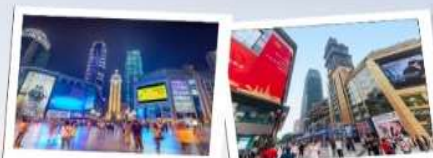
3. Guangyinqiao Pedestrian Street (观音桥步行街) - ถนนคนเดินใหญ่ที่สุดในฉงชิ่ง

📍 ที่ตั้ง : เขต Muzhong 🕒 เวลาเปิด-ปิด : 10:00 - 22:00 น. 💰 ค่าเช่า : ฟรี 🚶 การเดินทาง : รถไฟใต้ดินสาย 2 สถานี Liziba (李子坝站) 🚶 ไรด์ไลน์ : จุดถ่ายรูปแลนด์มาร์กของฉงชิ่งที่มีรถไฟวิ่งผ่ากลางลำน้ำ เป็นหัวใจของสถานีที่แปลกที่สุดในโลก ลองนั่งรถไฟสาย 2 ผ่านตึกแล้วจะรู้ว่ามีเรื่อง