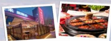
Peijie Hotpot (佩姐老火锅)

📍 ที่ตั้ง : เขต Muzhong 💰 ราคาเฉลี่ย : 80-150 หยวนต่อคน 🚶 การเดินทาง : รถไฟใต้ดินสาย 2 หรือ 6 สถานี Jiefangbei (解放碑站) แล้วเดินประมาณ 5 นาที 🚶 ไรด์ไลน์ : พริบไฟแดงอร่อยมากดีเยี่ยมดีใจมาก อู่ออ่ออ่ออ่อ นึกๆไปเปิดคอมฯหาเมนูแล้วเจอคุณภาพดี