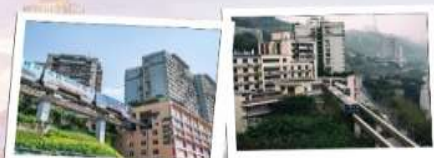
2. Liziba Station (李子坝站) - สถานีรถไฟทะเลสาบ

📍 ที่ตั้ง : เขต Muzhong 🕒 เวลาเปิด-ปิด : 10:00 - 22:00 น. 💰 ค่าเช่า : ฟรี 🚶 การเดินทาง : รถไฟใต้ดินสาย 2 สถานี Liziba (李子坝站) 🚶 ไรด์ไลน์ : จุดถ่ายรูปแลนด์มาร์กของฉงชิ่งที่มีรถไฟวิ่งผ่ากลางลำน้ำ เป็นหัวใจของสถานีที่แปลกที่สุดในโลก ลองนั่งรถไฟสาย 2 ผ่านตึกแล้วจะรู้ว่ามีเรื่อง