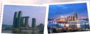
Option 2: Raffles City Chongqing (อยู่ตึกฉงชิ่ง) + คาเฟ่ Manner Coffee

📍 ที่ตั้ง : เขต Muzhong 🕒 เวลาเปิด-ปิด : 10:00 - 23:00 น. 💰 ค่าเช่า : ฟรี 🚶 การเดินทาง : รถไฟใต้ดินสาย 2 หรือ 6 สถานี Xiaozhizi (小什字站) แล้วเดินประมาณ 10 นาที 🚶 ไรด์ไลน์ : เมื่อไปทางตึกอันมีชื่อเสียงกลายเป็นแหล่งท่องเที่ยวที่ฮิตสุดของฉงชิ่งเห็นแล้วใจหายอยากลิ้มรสกาแฟในธีม Opt-Land Honey 📍 คาเฟ่แนะนำ : NUIS Coffee (坚果咖啡) 📍 ที่ตั้ง : ด้านบนของ Hongya Cave 💰 ราคาเฉลี่ย : 40-60 หยวน 🚶 ไรด์ไลน์ : คาเฟ่ที่มองเห็นวิวทิวทัศน์ที่สวยงามของเมืองฉงชิ่ง และท่าเรือที่มองเห็นเรือหวงโง่วจาก Hongya Cave