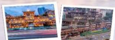
Option 1: Hongya Cave (洪崖洞) + คาเฟ่ NUIS Coffee

📍 ที่ตั้ง : เขต Muzhong 🕒 เวลาเปิด-ปิด : 10:00 - 23:00 น. 💰 ค่าเช่า : ฟรี 🚶 การเดินทาง : รถไฟใต้ดินสาย 2 หรือ 6 สถานี Xiaozhizi (小什字站) แล้วเดินประมาณ 10 นาที 🚶 ไรด์ไลน์ : เมื่อไปทางตึกอันมีชื่อเสียงกลายเป็นแหล่งท่องเที่ยวที่ฮิตสุดของฉงชิ่งเห็นแล้วใจหายอยากลิ้มรสกาแฟในธีม Opt-Land Honey 📍 คาเฟ่แนะนำ : NUIS Coffee (坚果咖啡) 📍 ที่ตั้ง : ด้านบนของ Hongya Cave 💰 ราคาเฉลี่ย : 40-60 หยวน 🚶 ไรด์ไลน์ : คาเฟ่ที่มองเห็นวิวทิวทัศน์ที่สวยงามของเมืองฉงชิ่ง และท่าเรือที่มองเห็นเรือหวงโง่วจาก Hongya Cave