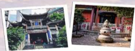
1. วัดหลัวฉวน (Luohan Temple, 罗汉寺) หรือ วัดฮวงผวน (Huayin Temple, 华严寺)

📍 ที่ตั้ง : เขต Muzhong 🕒 เวลาเปิด-ปิด : วัดหลัวฉวน : 08:00 - 17:00 น. / วัดฮวงผวน : 08:00 - 17:00 น. 💰 ค่าเช่า : ฟรี 🚶 การเดินทาง : รถไฟใต้ดินสาย 1 หรือ 6 สถานี Xiaozhizi (小什字站) แล้วเดินประมาณ 5 นาที วัดหลัวฉวน : รถไฟใต้ดินสาย 1 สถานี Daxuecheng (大学城站) แล้วเดินอีกประมาณ 10 นาที 🚶 ไรด์ไลน์ : วัดหลัวฉวน : วัดพุทธเก่าแก่ที่มีพระพุทธรูปหินแกะสลักสวยงาม วัดฮวงผวน : วัดพุทธขนาดใหญ่ที่โอบล้อม เขียวกับการตกแต่งต้นไม้เขียว