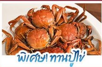
พิเศษ! ทานปูไข่

ปรากฏการณ์ธรรมชาติ 1 ปี มีแค่ครั้งเดียว! เตรียมชุดเก่งไปถ่ายรูปกับ 'หาดแดงผาเจ็้' ที่กำลังพรสมสีแดงสดไปทั่วผืนน้ำ พร้อมฟินสุดขีดกับฤดูกาลทานปูไข่ที่อร่อยที่สุดแห่งปี • สัมผัสวินิสแห่งตะวันออกที่ด้าหลุย