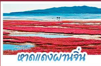
หาดแดงผาเจ็้