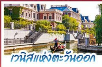
เวนิสแห่งตะวันออก