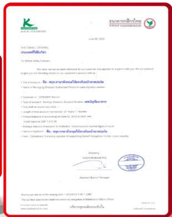
ตัวอย่าง Bank Guarantee ที่ผู้สมัครต้องส่งกับธนาคาร

** ชำระค่าทัวร์ในนาม บริษัท นิดน้อย ทราเวล จำกัดเท่านั้น **