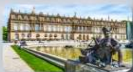
พระราชวัง Herrenchiemsee