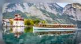
ทะเลสาบเคอนิกซี