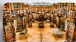
หอสมุดมรดกโลก St.Gallen