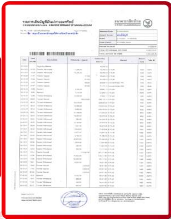
ตัวอย่าง Bank Statement ที่ผู้สมัครต้องส่งกับธนาคาร

3.4 ปรับสมุดบัญชีธนาคารตัวจริง และเตรียมไปในวันที่ยื่นวีซ่า