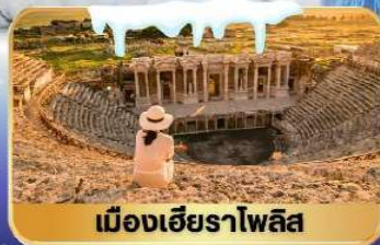
เมืองเฮียราโพลิส

✓ พักโรงแรมสโตน์ 2 คืน ✓ พิเศษ! อาหารจีนรสต้นตำรับ 1 มื้อ