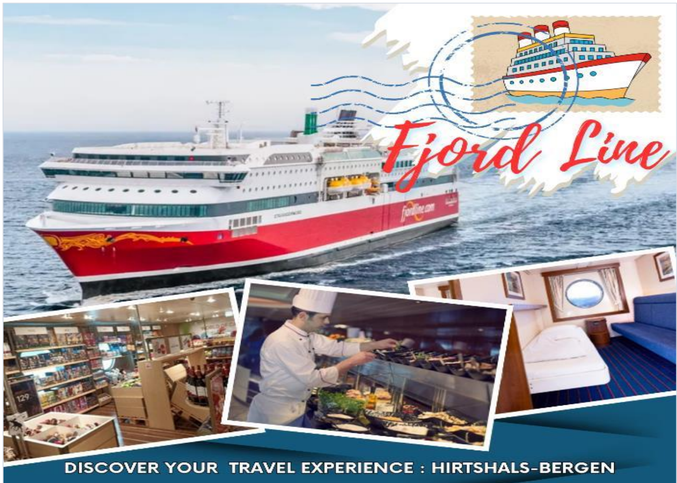
DISCOVER YOUR TRAVEL EXPERIENCE : HIRTSHALS-BERGEN

*** หากท่านต้องการอับเกรตห้องพักเป็นห้องสวีท กรุณาติดต่อเจ้าหน้าที่ ***