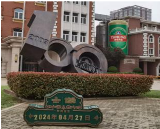
เกี่ยวกับเบียร์ชิงเต่า

นำท่านไป พิพิธภัณฑ์เบียร์ชิงเต่า (Tsingtao Beer Museum) ก่อตั้งขึ้นบนพื้นที่ของ โรงเบียร์เก่าแก่ของเยอรมัน ซึ่งเริ่มผลิตเบียร์ตั้งแต่ปี 1903 เป็นพิพิธภัณฑ์ที่จัดแสดงประวัติศาสตร์และกระบวนการผลิตเบียร์ชิงเต่า ชมกระบวนการผลิตเบียร์ ตั้งแต่การหมักจนถึงการบรรจุขวด เรียนรู้ ประวัติและวิวัฒนาการของเบียร์ชิงเต่า ชิมเบียร์สดหลากหลายรสชาติ ในบริเวณชิมเบียร์ (เฉพาะผู้ใหญ่) มี ร้านขายของที่ระลึก และของฝาก