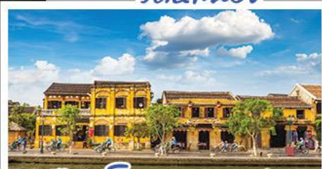
เมืองโบราณฮองอัน