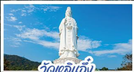
วัดเขลิอัน