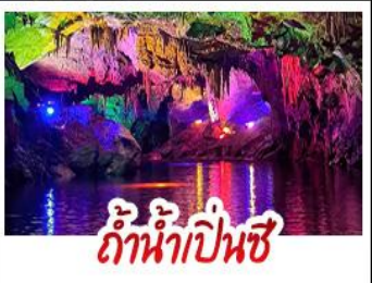
ถ้ำน้ำเป็นสี