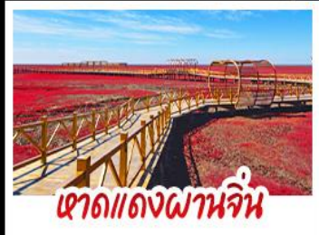
หาดแดงผานจัน