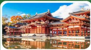
วัดเบียวโดอัน