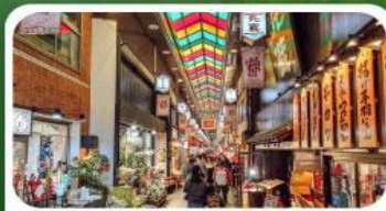
ตลาดปลาชิชิ