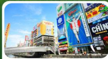
ช้อปปิ้งย่านชินโซบาชิ