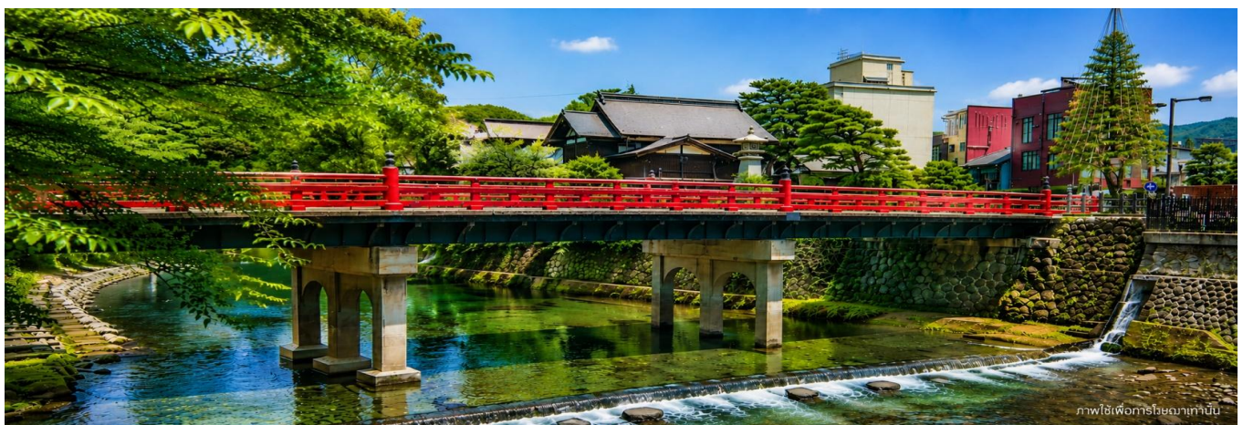
ภาพใช้เพื่อการโฆษณาเท่านั้น

สะพานนากะบาชิ (Nakabashi Bridge) สะพานสีแดงของย่านเมืองเก่า สะพานทอดข้ามแม่น้ำมิกาวะที่ไหลผ่านใจกลางเมือง สะพานแห่งนี้ถือเป็นสัญลักษณ์ของเมืองทาคายาม่า