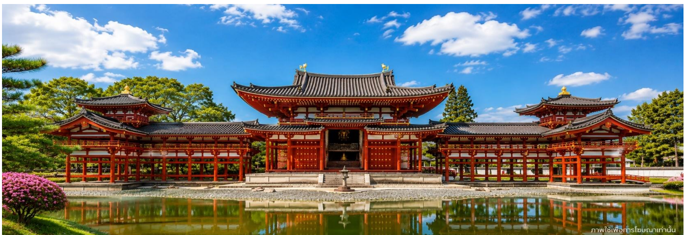
ภาพใช้เพื่อประชาสัมพันธ์เท่านั้น

นำทุกท่านเดินทางสู่ อุจิ Uji เมืองเล็กเปี่ยมเสน่ห์ทางตอนใต้ของ เกียวโต ที่มีชื่อเสียงระดับโลกด้าน “อุจิมัทฉะ” ชาเขียวคุณภาพเยี่ยมอันเป็นเอกลักษณ์ของญี่ปุ่น ภายในเมืองอบอวลด้วยบรรยากาศแสนสงบ รายล้อมไปด้วยร้านชาและคาเฟ่สไตล์ญี่ปุ่นสุดน่ารัก เหมาะแก่การเดินเล่นพักผ่อน พร้อมสัมผัสเสน่ห์วัฒนธรรมดั้งเดิม ท่ามกลางวัดวาอารามและโบราณสถานสำคัญที่ได้รับการขึ้นทะเบียนเป็นมรดกโลกจาก UNESCO อีกด้วย