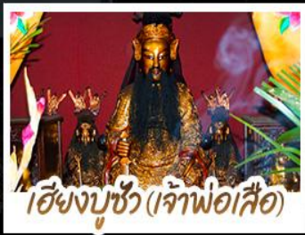
เซียงบูชิว (เจ้าพ่อเสือ)