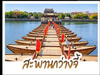
สะพานหวางจี้