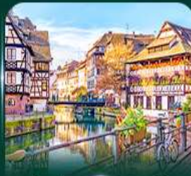
เทียวอัลซาส สตราสบูร์ก