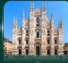
เซ็คจิน มหาวิหารดูโอโม มิลาน