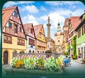
โรเรนเบิร์ก ออม เดียร์ เทาเบอร์