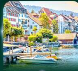
เมืองสวยริมทะเลสาบ ชุก