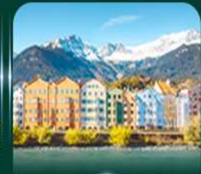
วาการ์สึลุกกวาด จินส์บรุค

** ชำระค่าทัวร์ในนาม บริษัท นิดน้อย ทราเวล จำกัดเท่านั้น **