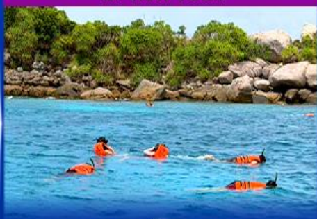
ทัวร์ดำน้ำ 4 เกาะ