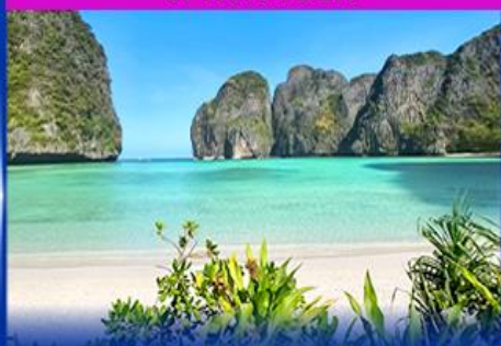
ท่องเที่ยวเกาะพีพี