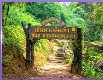
พีช 5 เป็นวัดใจ