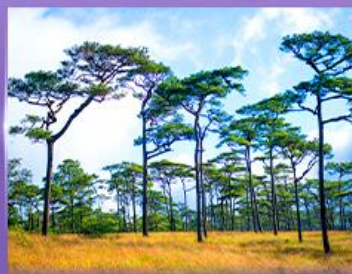
ลานสนกุสอยดาว