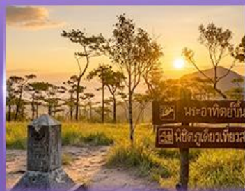
ชมพระอาทิตย์ขึ้น กุสอยดาว