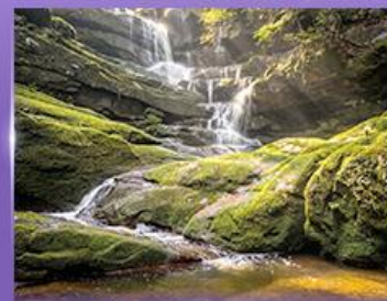
น้ำตกสายทิพย์

** ชำระค่าทัวร์ในนาม บริษัท นิดน้อย ทราเวล จำกัดเท่านั้น **