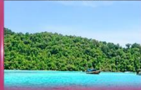
ทัวร์เกาะสุรินทร์

** ชำระค่าทัวร์ในนาม บริษัท นิดน้อย ทราเวล จำกัดเท่านั้น **