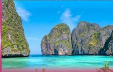
ทัวร์เกาะพีพี