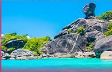
ทัวร์เกาะสิมิลัน