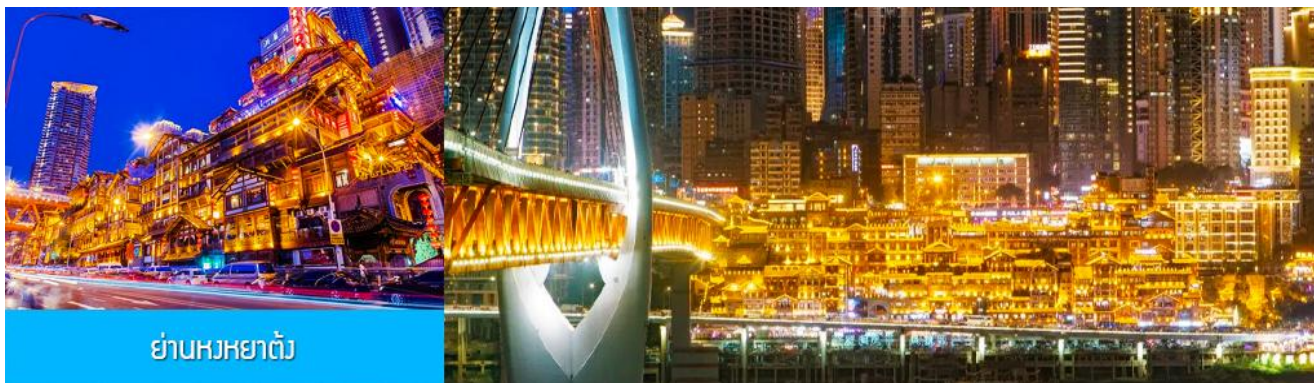
ย่านหงหยาดัง

** ชำระค่าทัวร์ในนาม บริษัท นิดน้อย ทราเวล จำกัดเท่านั้น **