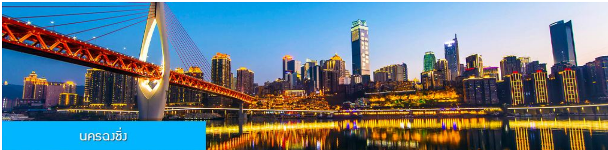
นครฉงชิ่ง

** ชำระค่าทัวร์ในนาม บริษัท นิดน้อย ทราเวล จำกัดเท่านั้น **