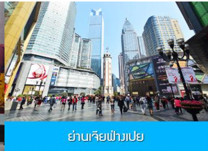
ย่านเจียฟ่างเปย

วันที่สาม ฉงชิ่ง - ร้านผลิตภัณฑียางพารา - The Ring Mall of Hongkong Land's Yorkville - ถนนโบราณริมผา (ซอยหน้าผา) ตึกตะเกียบ - ถนนคนเดินเจียฟ่างเปย - โถงจ่ายออฟชั่น ละครจีนตบิณิตสุดอลังการเรื่อง แม่น้ำแยงซี+สุกี้หมาล่า