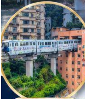
รถไฟทะลุตึก Liziba Station