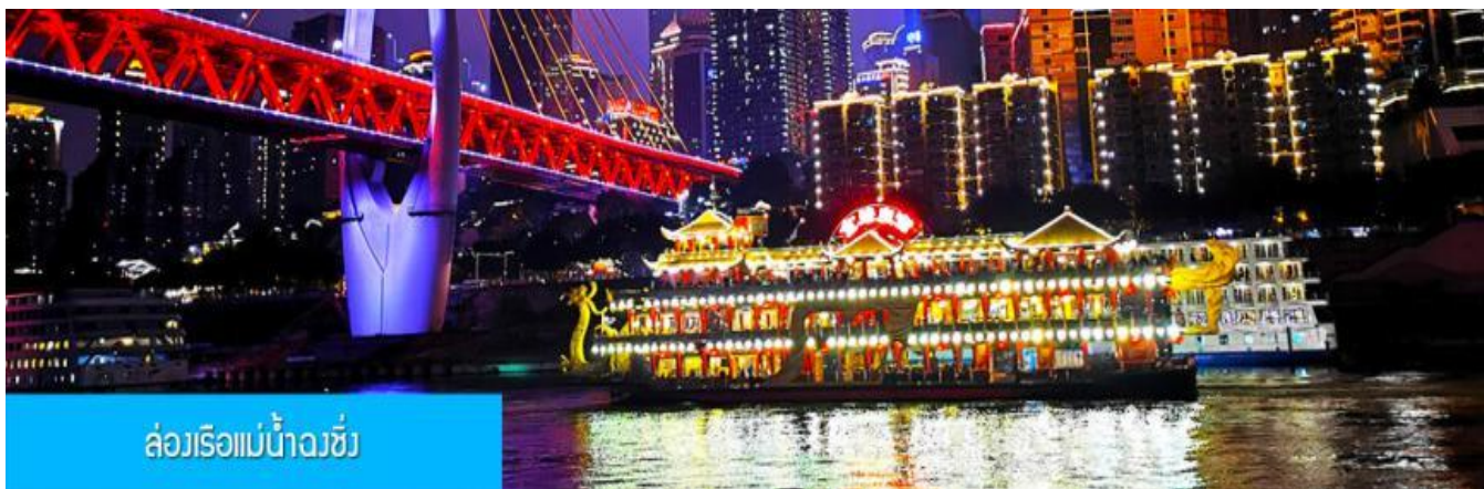
ล่องเรือแม่น้ำฉงชิ่ง