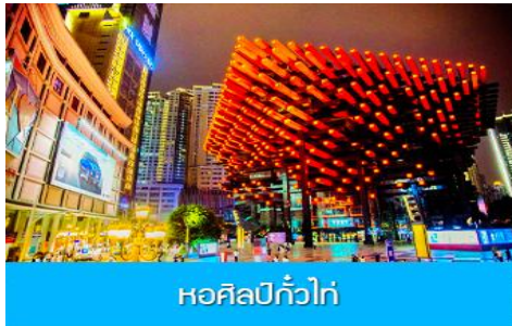
หอศิลป์กั๋วไถ่

ค่า อิสระอาหารมื้อค่ำ เพื่อให้ท่านได้เลือกชิมอาหารพื้นเมืองตามอริยาศัย พักที่ HOLIDAY INN EXPRESS HOTEL โรงแรมระดับ 4 ดาวหรือเทียบเท่า เมืองฉงชิ่ง