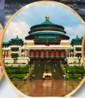
มหาศาลาประชาชน Great Hall of the People