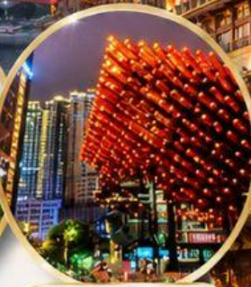
หอศิลป์กัวไท่ Guotai Arts Center