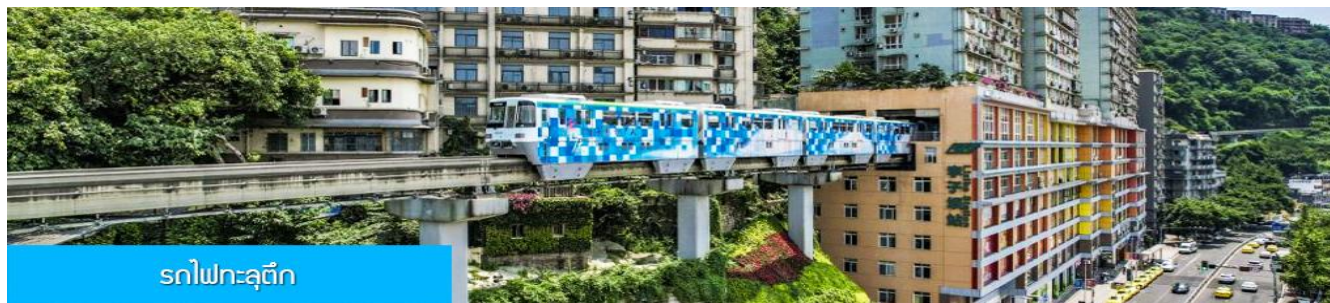
รถไฟกะลุดึก

คำ อิสระอาหารมื้อค่ำ เพื่อให้ท่านได้เลือกชิมอาหารพื้นเมืองตามอัธยาศัย พักที่ HOLIDAY INN EXPRESS HOTEL โรงแรมระดับ 4 ดาวหรือเทียบเท่า เมืองฉงชิ่ง