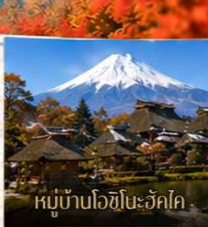
หมู่บ้านโอชิโนะอัสโค