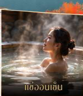
แช่ออนเซ็น