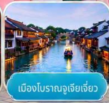
เมืองโบราณจูเจียเจี๋ย