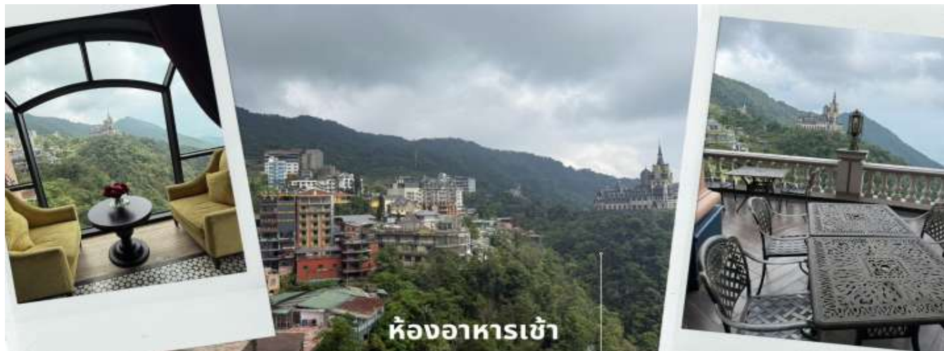
ห้องอาหารเช้า

** ชำระค่าทัวร์ในนาม บริษัท นิดน้อย ทราเวล จำกัดเท่านั้น **