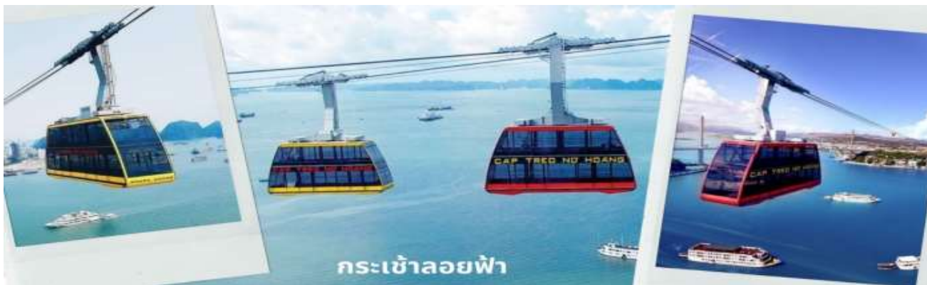
กระเช้าลอยฟ้า

จากนั้นนำท่านนั่ง Queen Cable Car กระเช้าลอยฟ้า 2 ชั้นที่ใหญ่ที่สุดในโลก จุดคนได้มากถึง 250 คนต่อเที่ยว สามารถรับ-ส่งผู้โดยสารได้มากถึง 2,000 คนต่อชั่วโมง กระเช้าลอยฟ้า 2 ชั้นยิ่งใหญ่อลังการนี้เป็นส่วนหนึ่งของ สวนสนุก Sun World Halong Park สร้างโดย Doppelmayr/Garaventa Group จากประเทศสวิตเซอร์แลนด์และออสเตรีย โดยมีความพิเศษที่สามารถทำลายสถิติโลก และได้รับการบันทึกลงใน Guinness World Records ถึง 2 รายการ คือ เป็นกระเช้าที่จุดคนได้มากที่สุดในโลก และมีเสาคอนกรีตส่งกระเช้าที่สูงที่สุดในโลก ด้วยความสูงถึง 188.88 เมตร