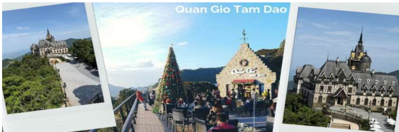
Quan Gio Tam Dao

จากนั้นนำท่านไป คาเฟ่ (Quan Gio Tam Dao) อยู่ที่เมืองตามด้าว ตั้งอยู่บนเนินเขาสูงราว 1,000 เมตรเหนือระดับน้ำทะเล ทำให้ได้สัมผัสสายลมเย็นๆได้ทั้งวันเลย คาเฟ่นี้ตั้งอยู่ใกล้กับโบสถ์หิน และจัตุรัสกลางเมืองตามด้าว ซึ่งเป็นแหล่งท่องเที่ยวหลักของเมืองนี้ ที่นี้มีปราสาทตามด้าว เป็นไฮไลท์ของที่นี่เลย ปราสาทสีขาวสุดอลังการที่ตั้งอยู่ท่ามกลางเขา เหมือนกับหลุดออกมาจากเทพนิยายยุโรป ร่วมกับบรรยากาศหมอกบาง ๆ ทำให้มุนีกลายเป็นหนึ่งในวิวที่โรแมนติกที่สุดในเมืองของตามด้าว