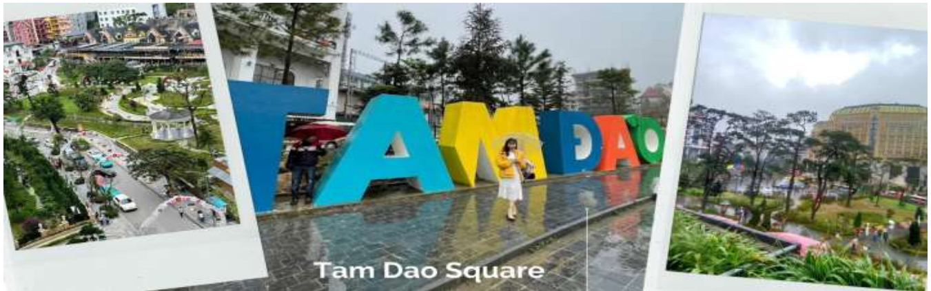
Tam Dao Square

** ชำระค่าทัวร์ในนาม บริษัท นิดน้อย ทราเวล จำกัดเท่านั้น **