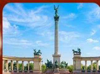
จัตุรัสวีรบุรุษ บูดาเปสต์