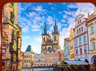
ชมย่านเมืองเก่า ปราก