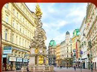
คาร์ทเนอร์ สตรีท ออสเตรีย