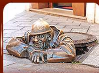
แลนด์มาร์คดัง รูปปั้นคูนิล บราติสลาวา

** ชำระค่าทัวร์ในนาม บริษัท นิดน้อย ทราเวล จำกัดเท่านั้น **