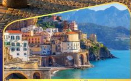
ชมวิวมอลฟีโคสท์