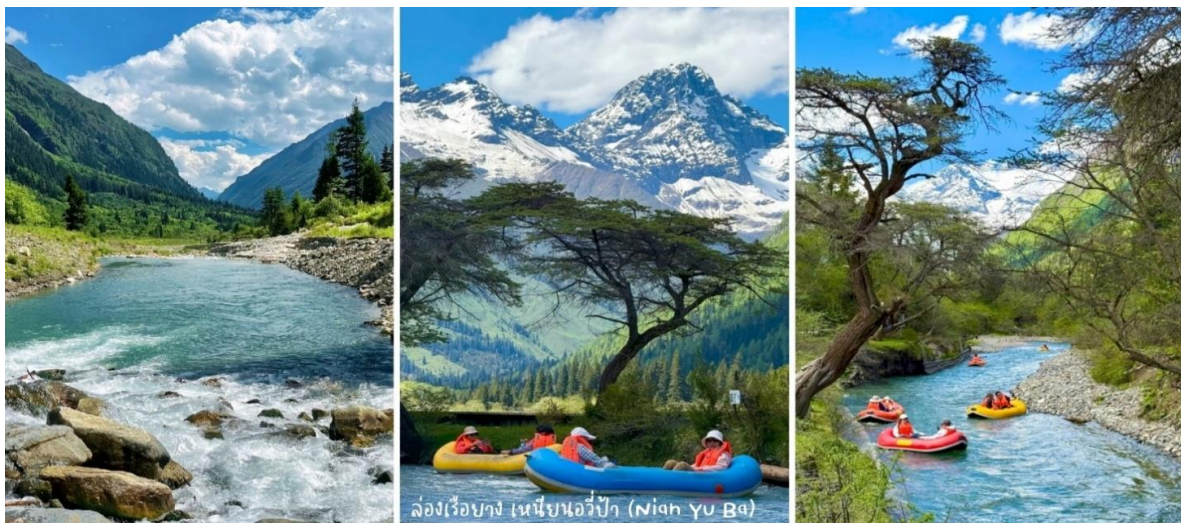
ล่องเรือยาง เหมียนอวี่ป่า (Nian Yu Ba)

จากนั้นนำท่าน ล่องเรือชมธรรมชาติที่อุทยานสีครุณี กับกิจกรรมยอดนิยม ล่องเรือยางสองที่นั่ง (รวมค่าล่องเรือ + นั่งลำละ2ท่าน ไม่มีคนพาย) ให้บริการที่จุดเหมียนอวี่ป่า (Nian Yu Ba) น้ำไหลเอื่อยๆ ชมวิวภูเขาหิมะ ป่าไม้ กุ้งหญาตลอดทางสัมผัสความสงบกลางหุบเขา รายล้อมด้วยภูเขาและป่าสน วิวดสวยละมุน มุมถ่ายรูปเพียบ ไธแมนติกและผ่อนคลาย ***ควรเตรียมหมวกกันแดดและเสื้อกันฝน***