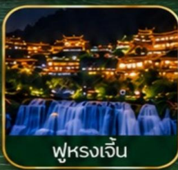
ฟูหรงเจิ้น