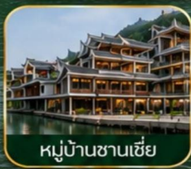
หมู่บ้านซานเซี่ย