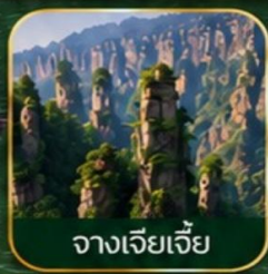
จางเจียเจีย