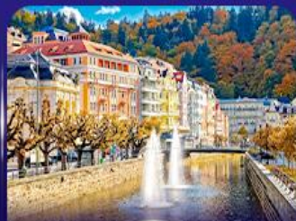
เมืองแห่งสปา คาร์โลวี วารี