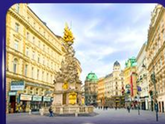
คาร์ทเนอร์ สตรีท เวียนนา

** ชำระค่าทัวร์ในนาม บริษัท นิดน้อย ทราเวล จำกัดเท่านั้น **