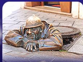
รูปปั้นคูนิล บราติสลาวา