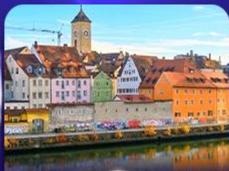
ย่านเมืองเก่า เรนเนสซองส์