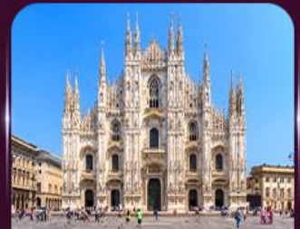
เซ็คจิน มหาวิหารดูโอโม มิลาน

** ชำระค่าทัวร์ในนาม บริษัท นิดน้อย ทราเวล จำกัดเท่านั้น **