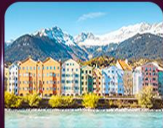
อาคารสีลูกกวาด อินส์บรุค