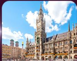
จัตุรัสบาเรียนพลาซซ์ มิวนิก