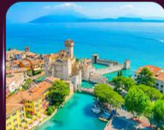
เมืองสวยริมทะเลสาบ เซอรัมิโอเน่