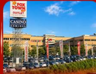
ฟ็อกซ์ทาวน์ เอาท์เล็ต