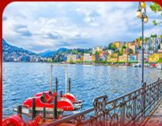
เมืองตากอากาศ ลูคาโน