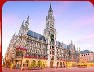
จัตุรัสมาเรียนพลัทซ์ บิเลเฟลด์