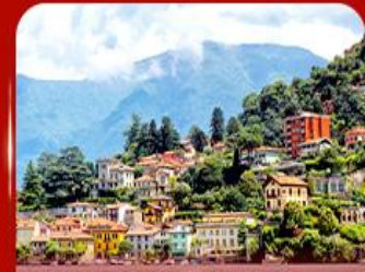
ชมวิวดสวย ทะเลสาบโคโม

** ชำระค่าทัวร์ในนาม บริษัท นิดน้อย ทราเวล จำกัดเท่านั้น **