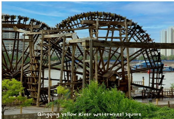
Qingqing Yellow River waterwheel square

** ชำระค่าทัวร์ในนาม บริษัท นิดน้อย ทราเวล จำกัดเท่านั้น **