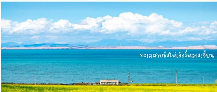
ทะเลสาบซิงไห่แอร์หลางเจี้ยน