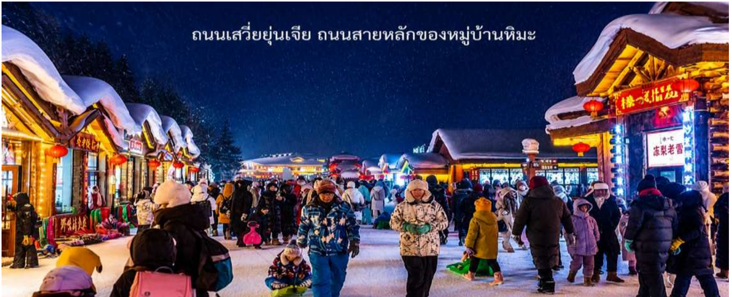
ถนนเสวี่ยยูนเจีย ถนนสายหลักของหมู่บ้านหิมะ

** ชำระค่าทัวร์ในนาม บริษัท นิดน้อย ทราเวล จำกัดเท่านั้น **