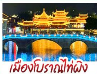
เมืองโบราณไท่ผิง