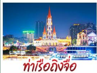
ท่าเรือถึงจื่อ

เขาส่งชิงสวนดอกไม้ตามฤดูกาล หมู่บ้านสไตล์ยุโรปเจียงยวี่ มิ่งซิง เสี่ยวจิ้น ถนนคนเดิน NANNING ZHIYE - เมืองโบราณไท่ผิง ท่าเรือถึงจื่อ - ถนนคนเดิน สามตรอกสองซอก