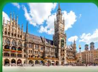
จัตุรัสมาเรียนพลัทซ์ มิวนิก