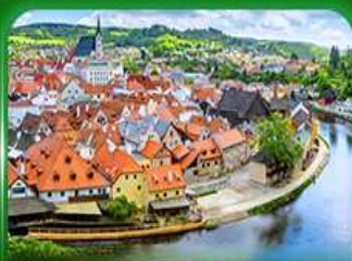
เมืองมรดกโลก เซสท์ครุมลอฟ