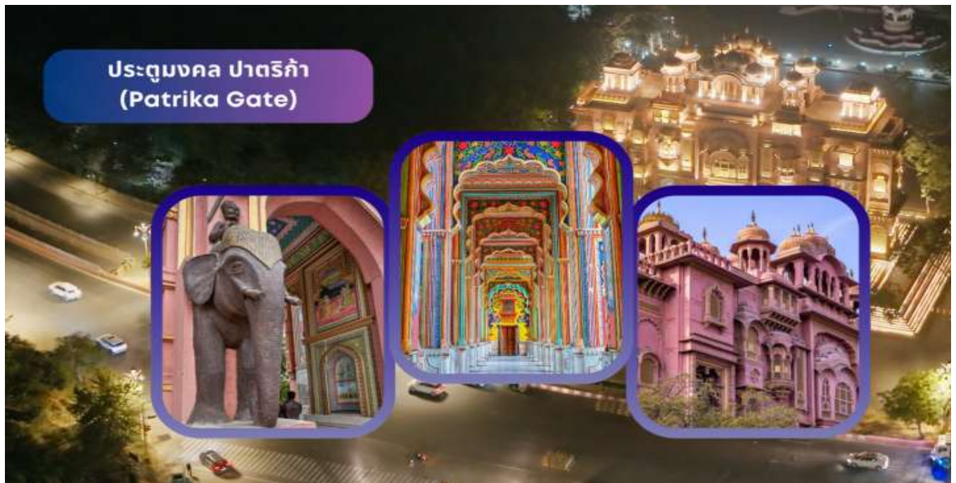
ประตูมงคล ปาทริกา (Patrika Gate)

ถึงเมืองชัยปุระ เขตอิน ประตูปาทริกา Patrika Gate เป็นแลนด์มาร์กยอดนิยมสำหรับถ่ายภาพในเมืองชัยปุระ โดดเด่นด้วยซุ้มประตูสีสดใสที่สะท้อนศิลปะและวัฒนธรรมของราชปุต ถือเป็นประตูสู่รัฐราชสถาน ตั้งอยู่บริเวณสวนทางเข้าวงเวียนจาวาฮาร์ (Jawahar Circle Garden) ในเมืองชัยปุระ เปิดใช้งานในปี 2016 โดยกลุ่มสื่อปาทริกา (Patrika Media Group) รับแรงบันดาลใจจากราชปุต วรรณกษัตริย์ ผู้ยังมีอิทธิพลต่อความเป็นอยู่ของชาวเมือง ประตูนี้ยังใช้เป็นจุดรวมทุกๆกิจกรรมของชาวชัยปุระในการเฉลิมฉลองเทศกาลต่างๆ เป็นมรดกทางภูมิปัญญาวัฒนธรรมของรัฐราชสถาน แสงสีของประตูชวนผู้มาเยือนต้องควักเทคนิคการถ่ายภาพเพื่อเป็นที่ระลึก อิสระเวลาท่านในการถ่ายภาพ ก่อนนำท่านเข้าสู่ที่พัก