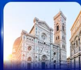
ชมเมืองแห่งศิลปะ ฟลอเรนซ์