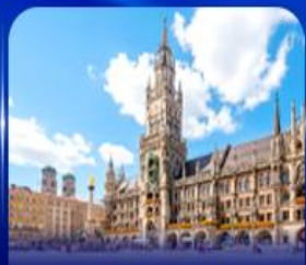
จัตุรัสมาเรียนพลัทซ์ มิวนิค