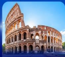
เข็ควินดัง โคโลสซียม โรม