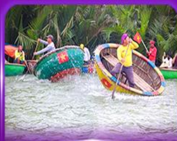
ล่องเรือกระดัง หมู่บ้านกิมทาน