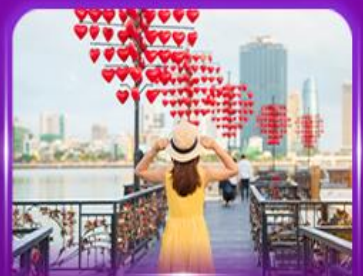
สะพานแห่งความรัก

** ชำระค่าทัวร์ในนาม บริษัท นิดน้อย ทราเวล จำกัดเท่านั้น **