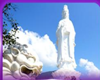
องค์กวนอิม วัดหลินจิ้ง