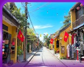
หมู่บ้านมรดกโลก ฮอยอัน