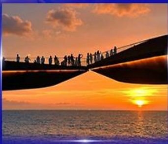
สะพานจูบ Sunset Town