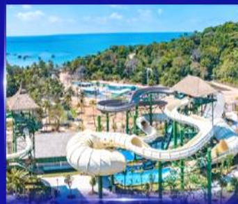
สวนสนุก Sun world Hon thom