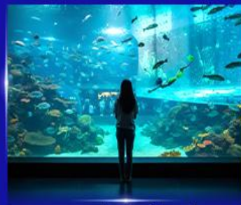
อควาเรียมยักษ์รูปเต่า