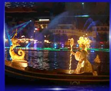
ชมโชว์วงนิสจำลอง แกรนด์วิลด์

** ชำระค่าทัวร์ในนาม บริษัท นิดน้อย ทราเวล จำกัดเท่านั้น **