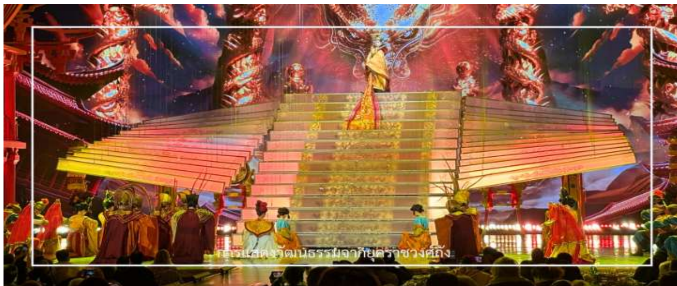
การแสดงวัฒนธรรมจากยุคราชวงศ์ถึง

ท่านจะได้ชมการแสดงวัฒนธรรมจากยุคราชวงศ์ถึง อันตะการตา ที่ผสมการพ้อนรำ เพลง และเครื่องแต่งกายงดงามอย่างประณีต ถ่ายทอดความรุ่งเรืองและชีวิตอันหรูหราของยุคถึง โดยนักแสดงมืออาชีพที่มีทักษะโดดเด่น