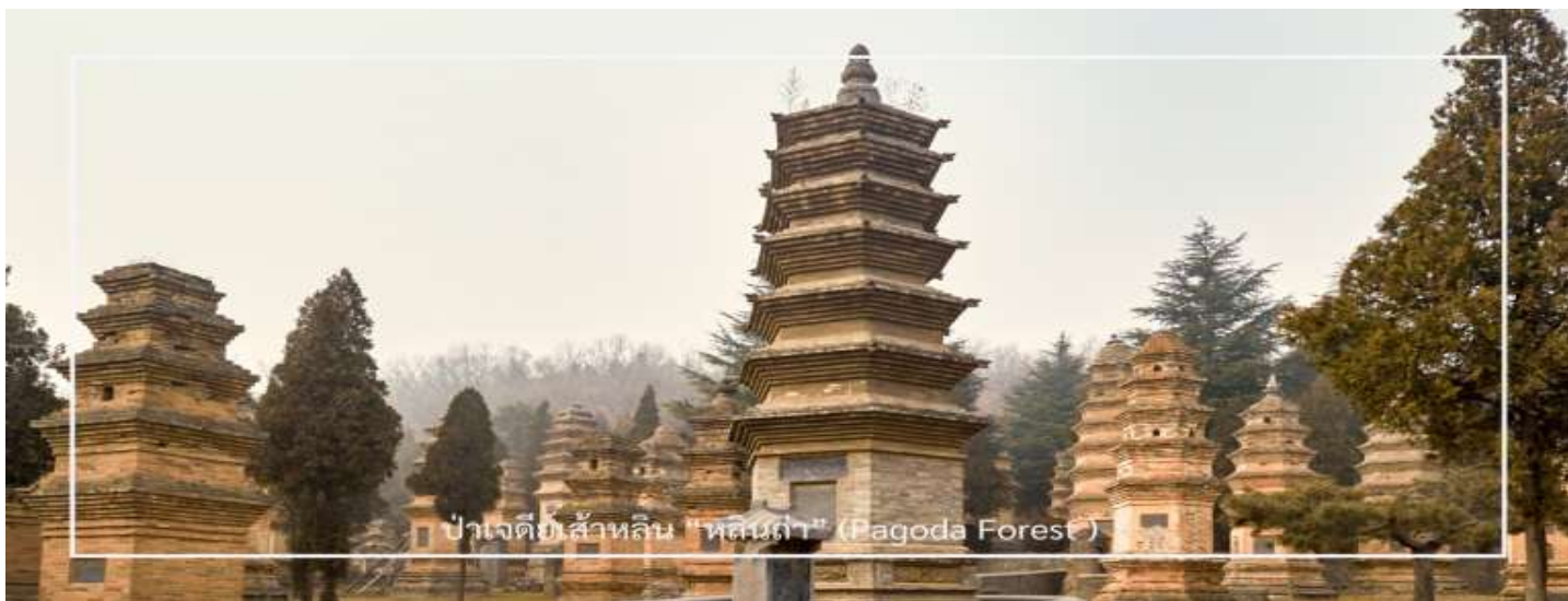
ป่าเจดีย์สล่าหลิน "หลินถา" (Pagoda Forest)

อวาสมูมิมทบากสำคัญในสายธรรมและวิทยาคุณ ภายในบริเวณเต็มไปด้วยเจดีย์หินจำนวนมากกว่า 240 องค์ ซึ่งบางองค์มีความสูงถึง 15 เมตร เจดีย์แต่ละองค์มีขนาดและรูปทรงแตกต่างกันไปตามยุคสมัย เช่น ทรงกลม ทรงสี่เหลี่ยม และทรงหกเหลี่ยม อีกทั้งยังประดับด้วยลวดลายแกะสลักอย่างวิจิตรงดงาม บางองค์มีจารึกที่บอกเล่าชีวประวัติของพระภิกษุผู้ได้รับการบูชา นั้น ๆ