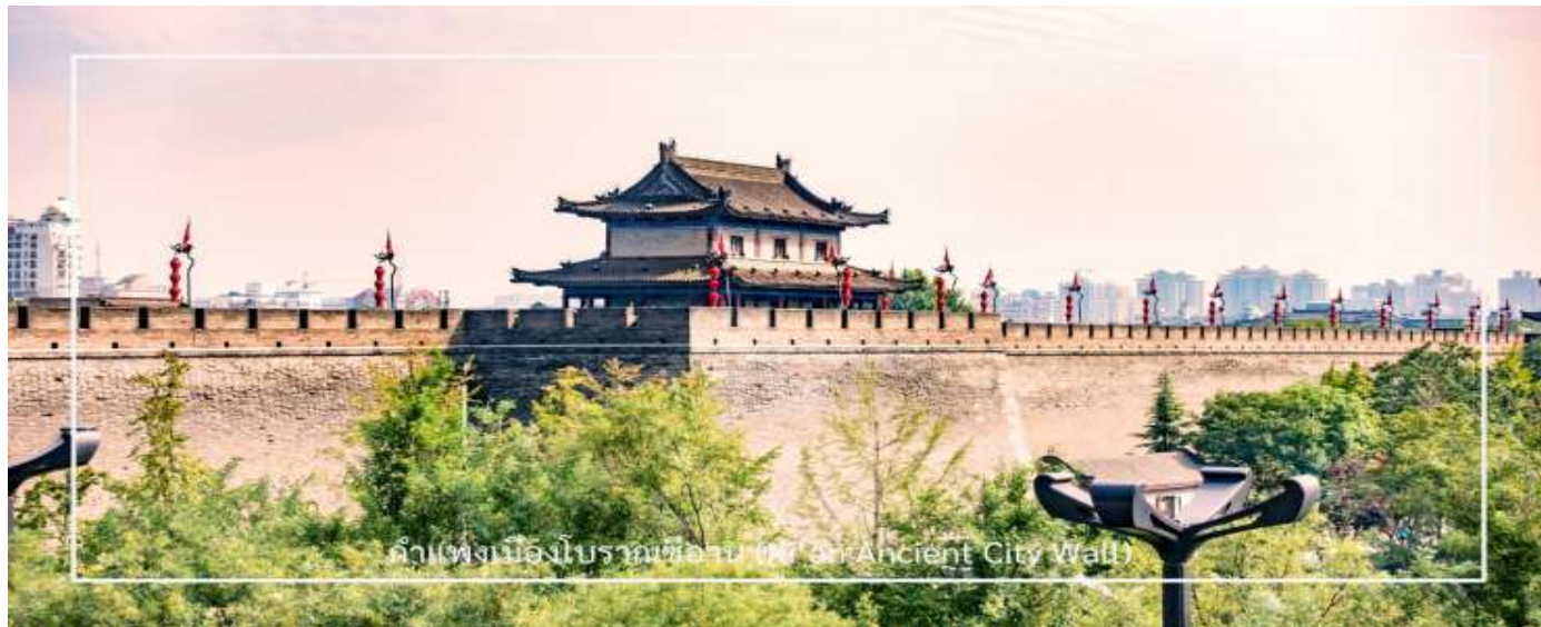
กำแพงเมืองโบราณซีอาน (Xi'an Ancient City Wall)

** ชำระค่าทัวร์ในนาม บริษัท นิดน้อย ทราเวล จำกัดเท่านั้น **