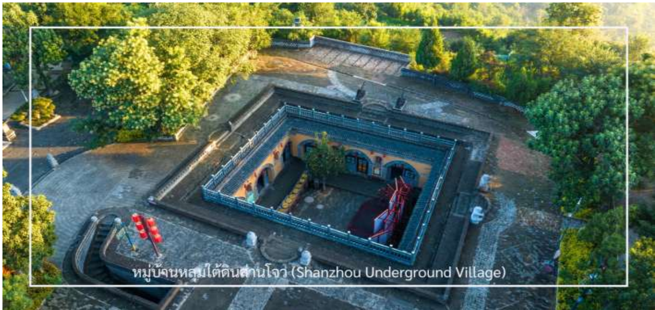
หมู่บ้านหลุมใต้ดินसानโจว (Shanzhou Underground Village)

นำท่านเดินทางสู่ หมู่บ้านหลุมใต้ดินसानโจว (Shanzhou Underground Village) แหล่งท่องเที่ยวเชิงวัฒนธรรมอันน่าทึ่งของมณฑลเหอหนาน สัมผัสเสน่ห์ของสถาปัตยกรรมท้องถิ่นที่หลอมรวมภูมิปัญญาดั้งเดิมเข้ากับธรรมชาติได้อย่างกลมกลืนหมู่บ้านแห่งนี้มีเอกลักษณ์เฉพาะตัวด้วยการสร้างบ้านในหลุมลึก มีลักษณะเป็นสี่เหลี่ยม มีลานกลางเปิดโล่ง พร้อมห้องพัก ห้องครัว และห้องนั่งเล่น ที่ได้จากการขุดเจาะผนัง โครงสร้างแบบนี้ไม่เพียงให้ความมั่นคงแข็งแรง แต่ยังให้ความอบอุ่นในฤดูหนาวและเย็นสบายในฤดูร้อน หมู่บ้านหลุมใต้ดินแห่งนี้สะท้อนวิถีชีวิตเรียบง่ายของชาวบ้านที่สืบทอดต่อกันมาหลายชั่วอายุคน ปัจจุบันได้รับการอนุรักษ์และพัฒนาเป็นแหล่งท่องเที่ยวเชิงวัฒนธรรมที่น่าสนใจ