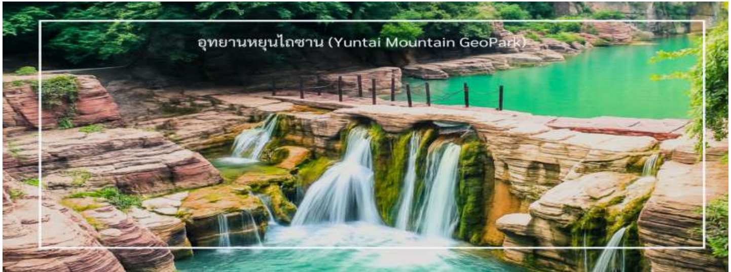
อุทยานหยุนไทซาน (Yuntai Mountain GeoPark)

** ชำระค่าทัวร์ในนาม บริษัท นิดน้อย ทราเวล จำกัดเท่านั้น **