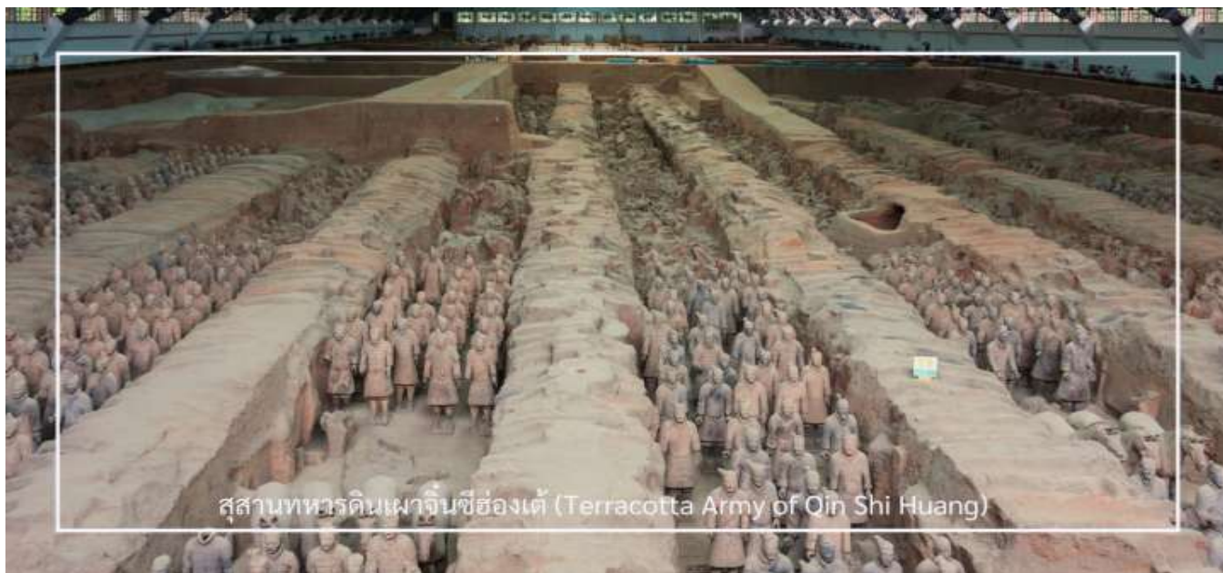
สุสานทหารดินเผาจีนซีฮ่องเต้ (Terracotta Army of Qin Shi Huang)

นำท่านเดินทางสู่ สุสานทหารดินเผาจีนซีฮ่องเต้ (Terracotta Army of Qin Shi Huang) หนึ่งในสิ่งมหัศจรรย์ของโลกยุคโบราณและแหล่งโบราณคดีที่สำคัญที่สุดของจีน ตั้งอยู่ใกล้เมืองซีอาน มณฑลส่านซี ค้นพบโดยบังเอิญในปี ค.ศ. 1974 ก่อนจะได้รับการขึ้นทะเบียนเป็นมรดกโลก โดยยูเนสโกในปี ค.ศ. 1987 สุสานแห่งนี้คือสถานที่ฝังพระศพของ “จีนซีฮ่องเต้” จักรพรรดิองค์แรกของจีนผู้รวบรวมแผ่นดินเป็นหนึ่งเดียวในยุคราชวงศ์ฉิน ครอบคลุมพื้นที่หลายหมื่นตารางเมตร แบ่งเป็น 3 หลุม ซึ่งภายในมีทหารดินเผากว่า 8,000 ตัว ที่ถูกสร้างขึ้นอย่างประณีต มีใบหน้า ท่าทาง และเครื่องแต่งกายแตกต่างกันไป พร้อมด้วยรถศึก ม้า และอาวุธโบราณ ที่วางเรียงรายอย่างเป็นระเบียบในหลุมฝังศพ เพื่อปกป้องจักรพรรดิในชีวิตหลังความตาย