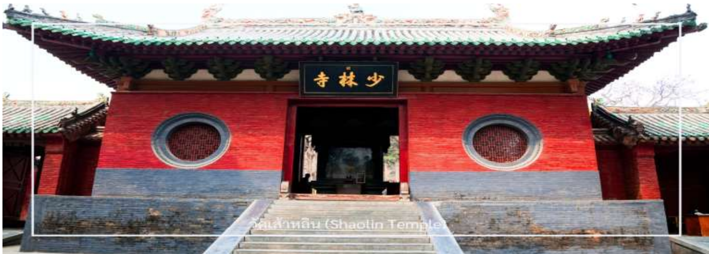
วัดเส้าหลิน (Shaolin Temple)

** ชำระค่าทัวร์ในนาม บริษัท นิดน้อย ทราเวล จำกัดเท่านั้น **