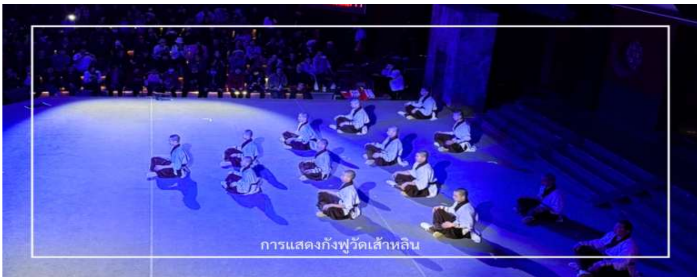
การแสดงกังฟูวัดเส้าหลิน

ไม่พลาด! กับประสบการณ์สุดพิเศษ ชมการแสดงกังฟูวัดเส้าหลิน ศิลปะการป้องกันตัวระดับตำนานที่เลื่องชื่อไปทั่วโลก การแสดงถ่ายทอดความแม่นยำ รวดเร็ว และแข็งแกร่งของวิทยายุทธเส้าหลิน ผ่านกระบวนการที่ได้รับความบันเทิงจากสัตว์นาขนินิค เช่น เสือ จู กระเรียน ผสานเข้ากับการตีลังกา หมุนตัว และการควบคุมร่างกายอันน่าทึ่ง ด้วยแสง สี เสียง และดนตรีประกอบฉากที่จัดเต็ม ทำให้โชว์นี้เต็มไปด้วยพลังและความเร้าใจ นอกจากนี้ ผู้ชมยังมีโอกาสได้มีส่วนร่วมกับเวที เพิ่มความสนุกสนาน และประทับใจไม่รู้ลืม