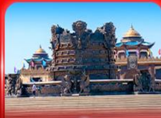
ศูนย์วัฒนธรรม มองโกเลีย หยวนหลิว