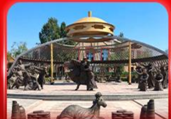
สวนวัฒนธรรมการแต่งจานออร์ดอส

** ชำระค่าทัวร์ในนาม บริษัท นิดน้อย ทราเวล จำกัดเท่านั้น **