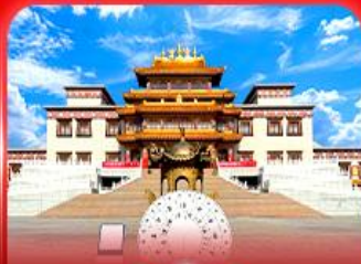
วัดพระโพธิสัตว์อูลาน