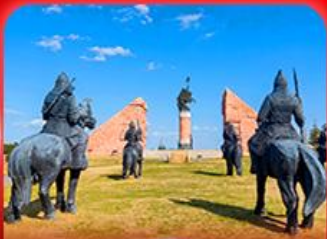
สวนสาธารณะเจงกิสข่าน