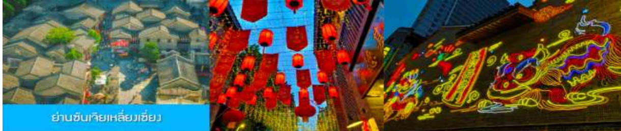
ย่านชานเจียเหลียงเซียง

16.03 น. ขบวนรถไฟเดินทางถึงสถานีรถไฟเมืองหนานหนิง นำท่านเดินทางเข้าสู่ตัวเมือง