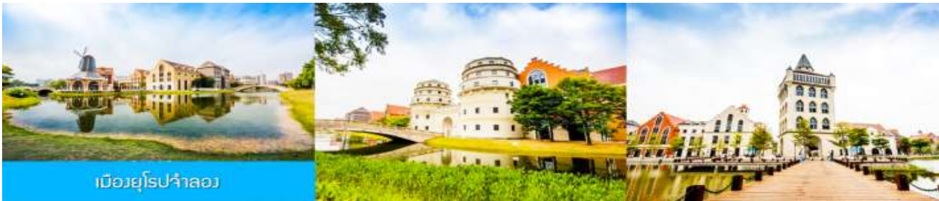
เมืองยุโรปจำลอง

เช้า รับประทานอาหารเช้า ณ ห้องอาหารของโรงแรม (12)