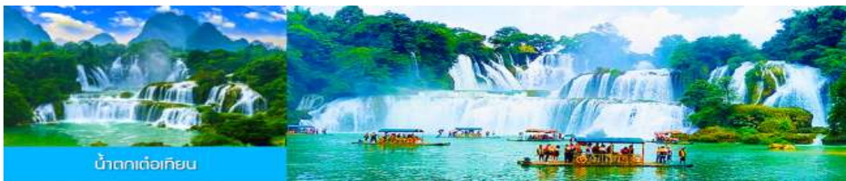
น้ำตกเต๋อเทียน