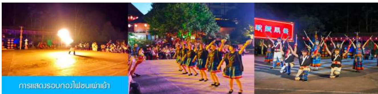
การแสดงรอบกองไฟชนเผ่าเย้า

หลังอาหารท่านสามารถชม การแสดงรอบกองไฟ 篝火表演 เป็นการแสดงพื้นเมืองของชนเผ่าเย้า (การแสดง รอบกองไฟจะงดจัดการแสดงในวันที่สภาพอากาศไม่เอื้ออำนวย)