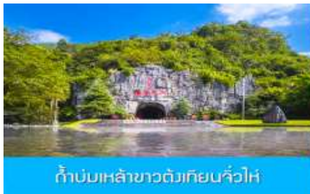
ถ้ำบ่มเหล้าขาวตั้งเทียนจิ้งไห่

วันที่สี่ เมืองหนานตัน- ถ้ำบ่มเหล้าขาวตั้งเทียนจิ้งไห่ –เมืองลี่ปัว - อุทยานเสี้ยวซือโข่ง เช้า รับประทานอาหารเช้า ณ ห้องอาหารของโรงแรม (7)