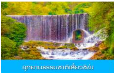
อุทยานธรรมชาติเสี้ยวซิง

เที่ยง รับประทานอาหารกลางวัน ณ ภัตตาคาร (8)