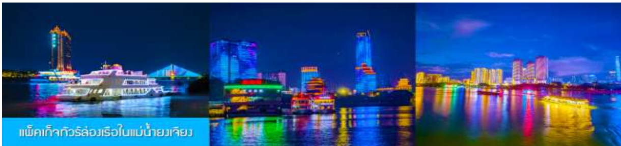
แพ็คเกจทัวร์ล่องเรือในแม่น้ำยวเจียง

อิสระอาหารค่ำ เพื่อความสะดวกและคล่องตัวในการเดินช้อปปิ้ง โดยท่านสามารถลิ้มลองอาหารท้องถิ่นหลากหลายรสชาติได้ตามอัธยาศัย