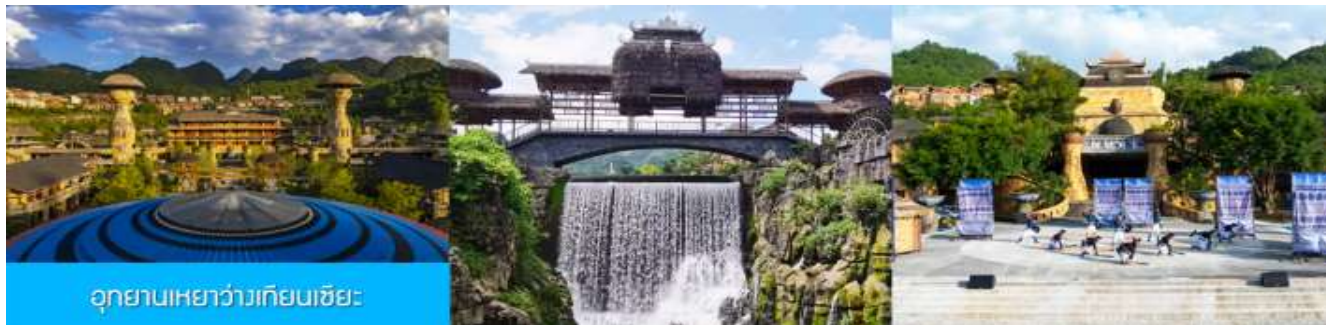
อุทยานเหยาว่างเทียนเซียะ

จากนั้นนำท่านเดินทางสู่ เมืองหนานตัน 南丹 (ระยะทาง 130 กม.ใช้เวลาเดินทางราว 2 ชั่วโมง)