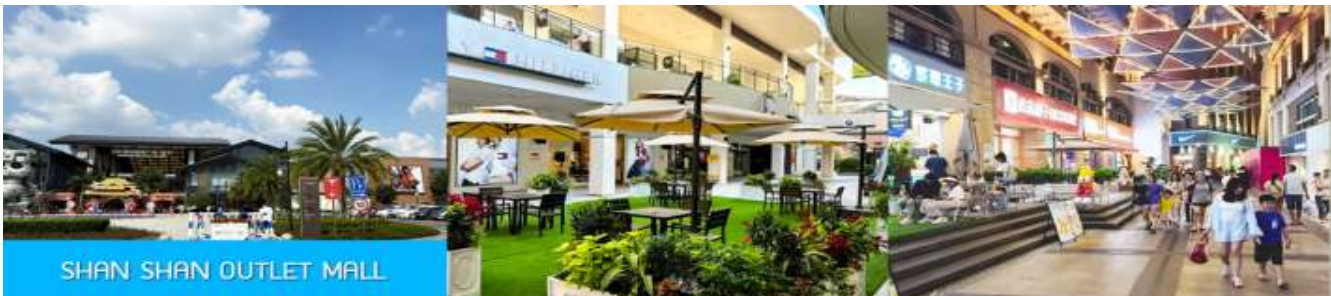
SHAN SHAN OUTLET MALL