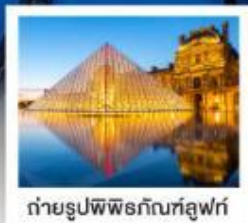
ถ่ายรูปพีไฟร์กันที่ลูฟร์