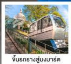
ขึ้นรถรางสู่บุงมาร์ต