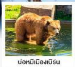
บ่อหมีเมืองเบิร์น