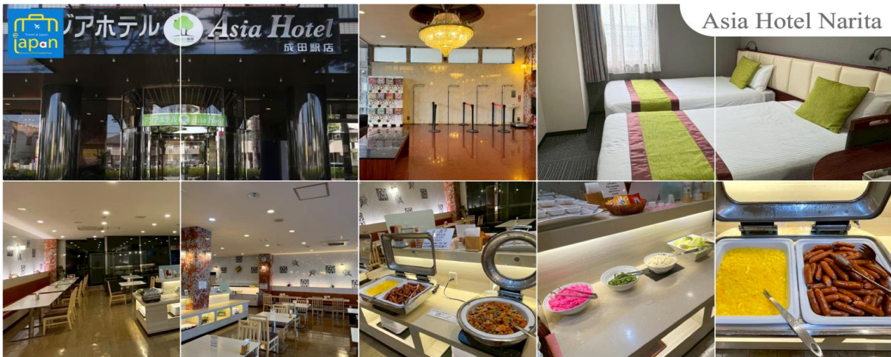
Asia Hotel Narita

** ชำระค่าทัวร์ในนาม บริษัท นิดน้อย ทราเวล จำกัดเท่านั้น **