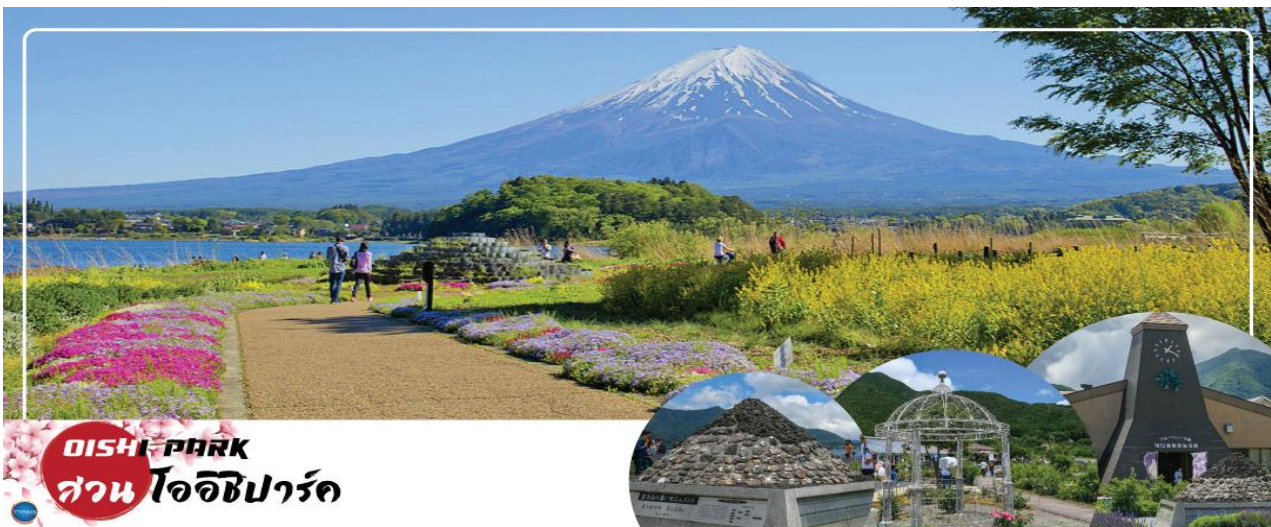
OISHI PARK สวนโออิชิพาร์ค

จังหวัดยามานาชิ – สวนสาธารณะโออิชิ – การเรียนพิธีชงชาญี่ปุ่น – เมืองนาริตะ – อีออน มอลล์ นาริตะ – ท่าอากาศยานนานาชาตินาริตะ