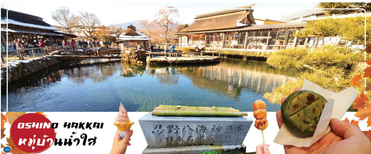
OSHINO HAKKAI หมู่บ้านน้ำใส

นำท่านเดินทางสู่ หมู่บ้านโอชิโนะฮัคไค (Oshino Hakkai) ให้ท่านเจาะลึกตามหาแหล่งน้ำบริสุทธิ์จากภูเขาไฟฟูจิ ที่เป็นแหล่งน้ำตามธรรมชาติตั้งอยู่ในหมู่บ้านโอชิโนะ จ.ยามานาชิ หรือพูดในทางกลับกันคือกลุ่มน้ำพุร้อนโอชิโนะฮัคไค เพียงก้าวแรกที่ย่างเท้าเข้าไปในหมู่บ้านก็สัมผัสได้ถึงอากาศบริสุทธิ์ และไอเย็นจากแหล่งน้ำธรรมชาติที่มีให้เห็นอยู่ทุกมุม โดยในบ่อน้ำใสแจ๋วมีปลาหลากหลายพันธุ์แหวกว่ายอย่างสบายอารมณ์ แต่ขอบอกเลยว่าน้ำแต่ละบ่อนั้นเย็นจับใจจนแอบสงสัยว่าน้องปลาไม่หนาวสะท้านกันบ้างหรือ เพราะอุณหภูมิในน้ำเฉลี่ยอยู่ที่ 10-12 องศาเซลเซียสนอกจากชมแล้วยังมีน้ำพุจากธรรมชาติให้ตกดื่มตามอริยาศัย และที่สำคัญ หมู่บ้านโอชิโนะยังเป็นแหล่งช้อปปิ้งสินค้าโอท็อปชั้นเยี่ยมอีกด้วย