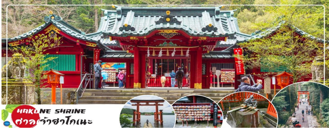
HAKONE SHRINE ศาลเจ้าฮาโกเนะ

** ชำระค่าทัวร์ในนาม บริษัท นิดน้อย ทราเวล จำกัดเท่านั้น **