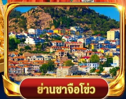
ย่านซาจื่อโข่ว