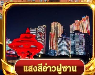
แสงสีอ่าวฟู่ซาน